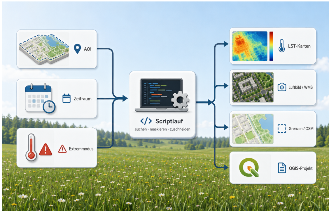
Abbildung 1: Das Datenpaket entsteht aus AOI, Zeitraum und Extremmodus.