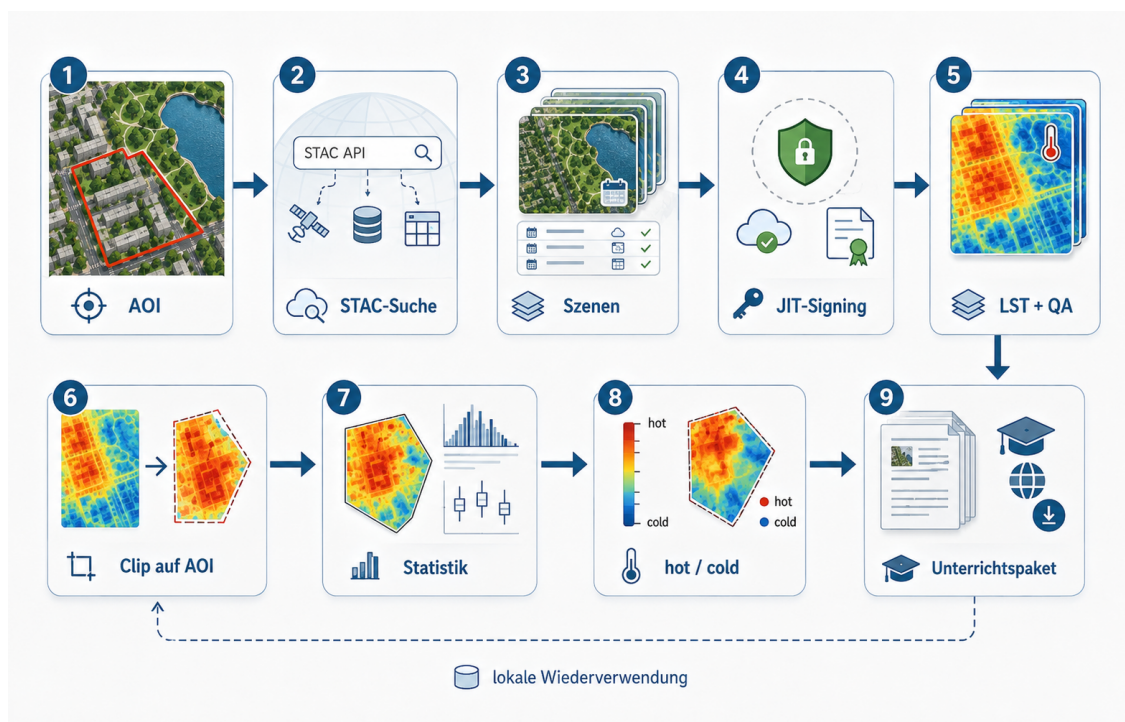
Abbildung 3: Technischer Datenfluss vom AOI zur QGIS-Projektdatei.

Der technische Ablauf lässt sich so zusammenfassen: